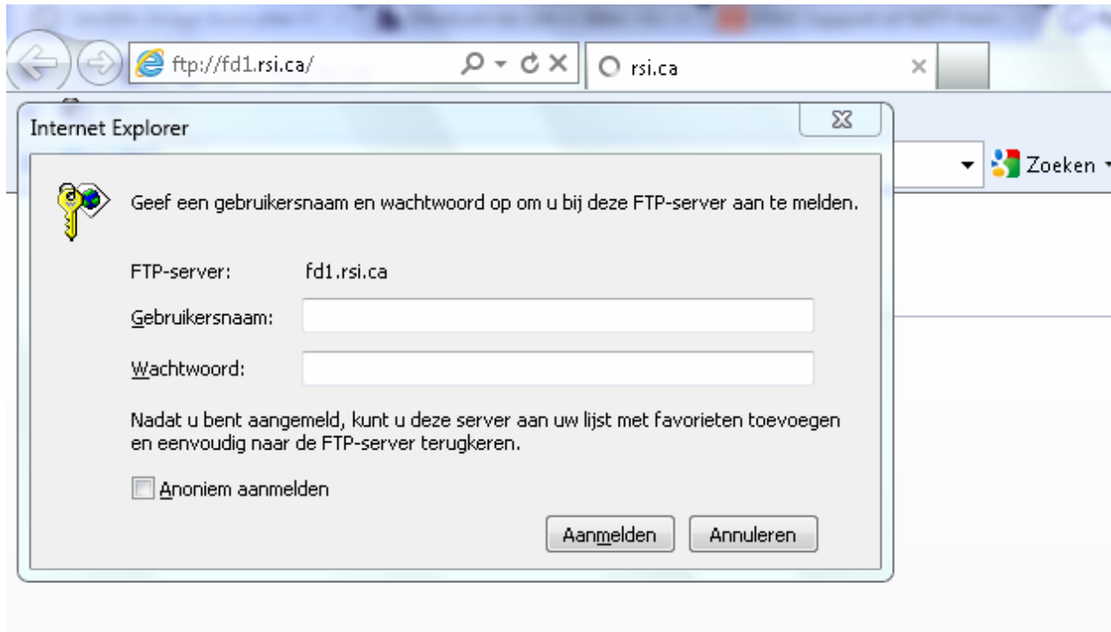
Figuur 2: Login scherm

Gebruikt u een webbrowser dan wordt vervolgens gevraagd uw login-gegevens in te vullen (zie figuur 1).